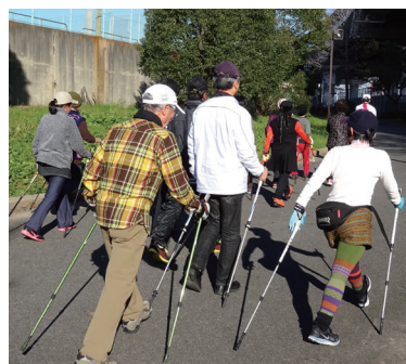
ノルディック ウォーキング